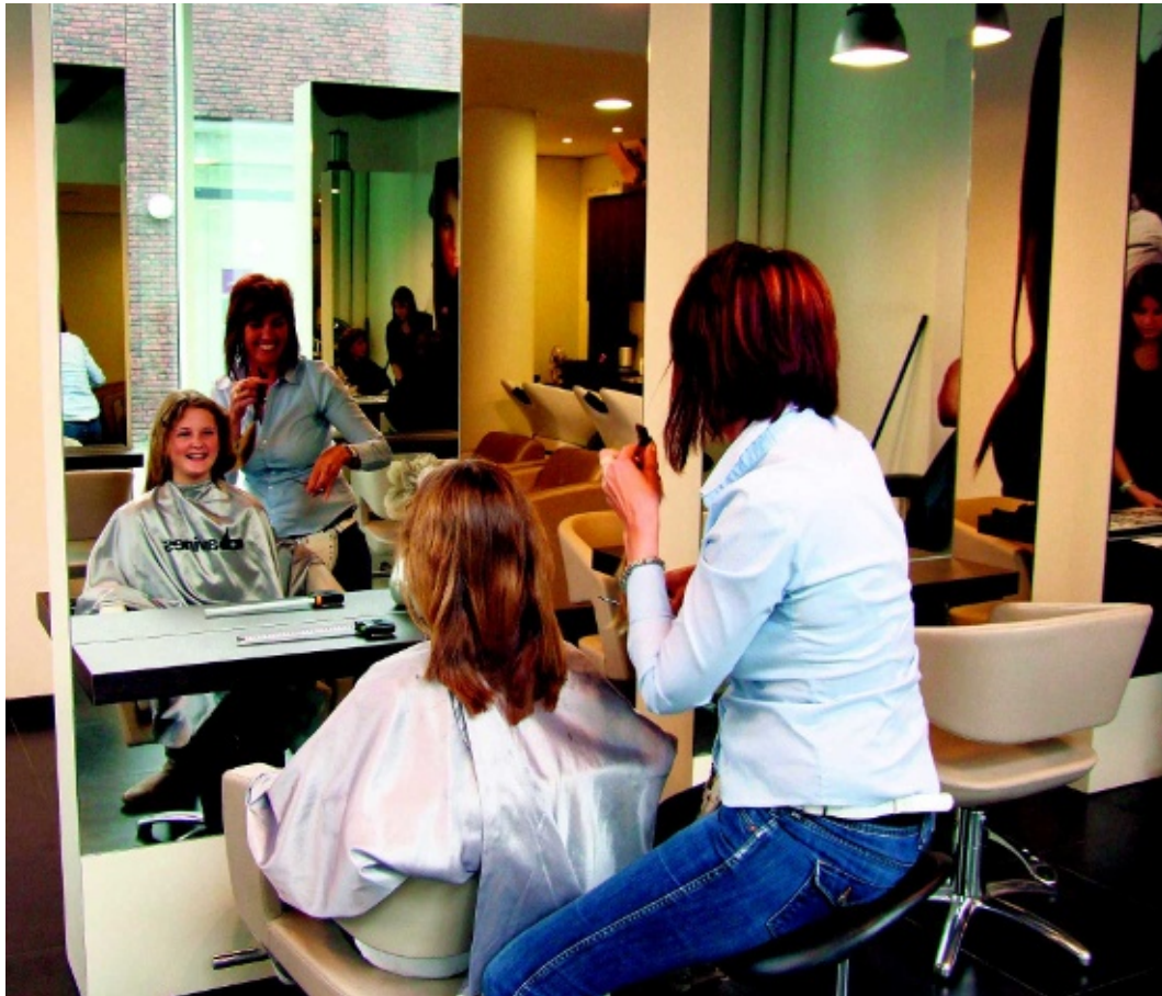
Het blijft natuurlijk een spannend moment, als de schaar er in gaat.